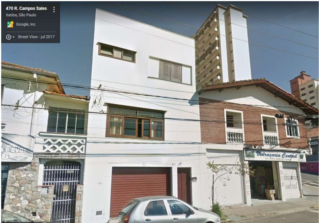
Imagem do imóvel penhorado capturado no Google Maps.